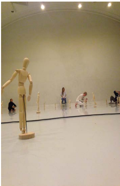
FRA MIND THE GAP 2016

Husleien til leietakerne ble i 2016 økt med 25%, noe som var første økning etter 2003. Lokalet var leid ut 314 dager til 68 leietakere. 20 av disse hadde forestillinger/visninger for til sammen 1816 publikummere, og på Scenehusets Facebook-side ble det publisert korte intervjuer med alle som hadde visninger. Som en rimelig oppgradering ble det kjøpt inn stoler i to høyder for å møte behovet for amfi, og det ble installert dimmere på taklyset i salen.