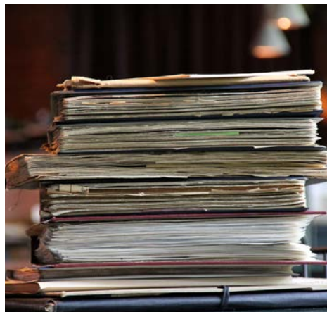
ALBUM TILARKIVERING

Arbeidet med Dansearkivet var utfordrende i 2016 fordi mangel på friske midler ga lav progresjon. Et høydepunkt var likevel at det ble signert en avtale med Riksarkivet om avlevering og oppbevaring av materialet. Danseinformasjonen (DI) økte produksjonen av egne tekster om dansekunst, og de ansatte skrev flere aktuelle saker på danseinfo.no. Det største løftet for kunstarten på lenge, fra DIs side, var utgivelsen av Bevegelser - Norsk dansekunst i 20 år . Boken ble lansert i desember, og har skapt debatt og engasjement.