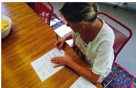
Signering av 10-årskontrakt

Det ble holdt åtte dansehistoriske foredrag i 2015 basert på materiale fra Dansearkivet. Fire av dem i Rogaland på Vågen vgs, Skeisvang vgs, Universitet i Stavanger og Stavanger katedralskole. Resten ble holdt på Dansens Hus for studenter og elever ved Intensivt kveldsstudium i dans, Balletthøgskolen ved KHiO sammen med Musikkteaterhøgskolen, Thor Heyerdal vgs og Trøndertun fhs.