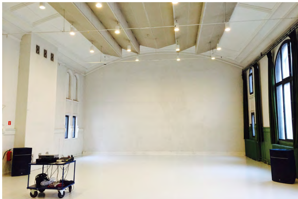
Scenehuset med nytt gulv

Scenehuset ble brukt til produksjon av forestillinger, kursvirksomhet og til visninger av produksjoner i mindre format. 54 leietakere benyttet lokalene i 320 dager, og det ble vist åtte danseproduksjoner (19 forestillinger), to konserter samt fire åpne kvelder under Dansens Dager, med totalt antall publikum på 1200.