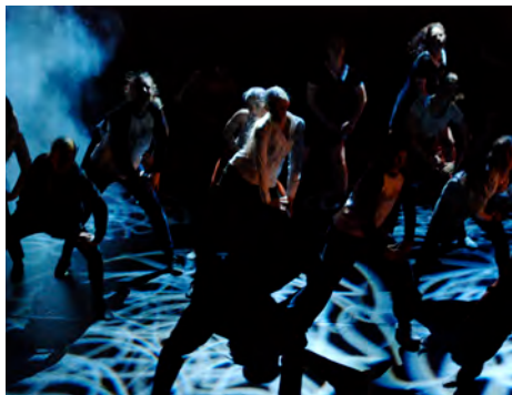
Dansens Dager-dansen på Åpen Scene