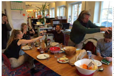
• Lunsj med gjester i Danseinformasjonen