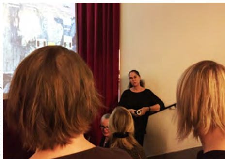
Dansehistorisk kino

DI er skolebibliotek for Norges Dansehøyskole, Skolen for Samtidsdans, Musikkteaterhøyskolen og NSKI Høyskole. I 2015 ble det lagt inn 90 nye titler i basen og lånt ut 257 bøker. DIs bibliotek er Norges største dansefaglige bibliotek og inneholder 2245 bøker og filmer i tillegg til en rekke tidsskrifter. Biblioteket er åpnet for alle.