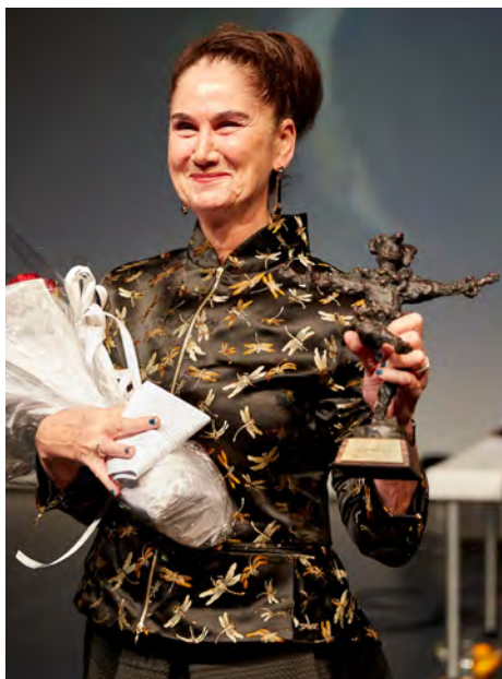
Æresprisen 2015

Dansens Hus og DI samarbeider om skolebesøk, omvisning og informasjon om Dansens Hus' virksomhet og DIs drift og funksjon. Det var til sammen 156 elever og studenter på besøk, fra NSKI Høyskole, Norges Dansehøyskole, Spin Off forstudium i dans og Edvard Munch vgs.