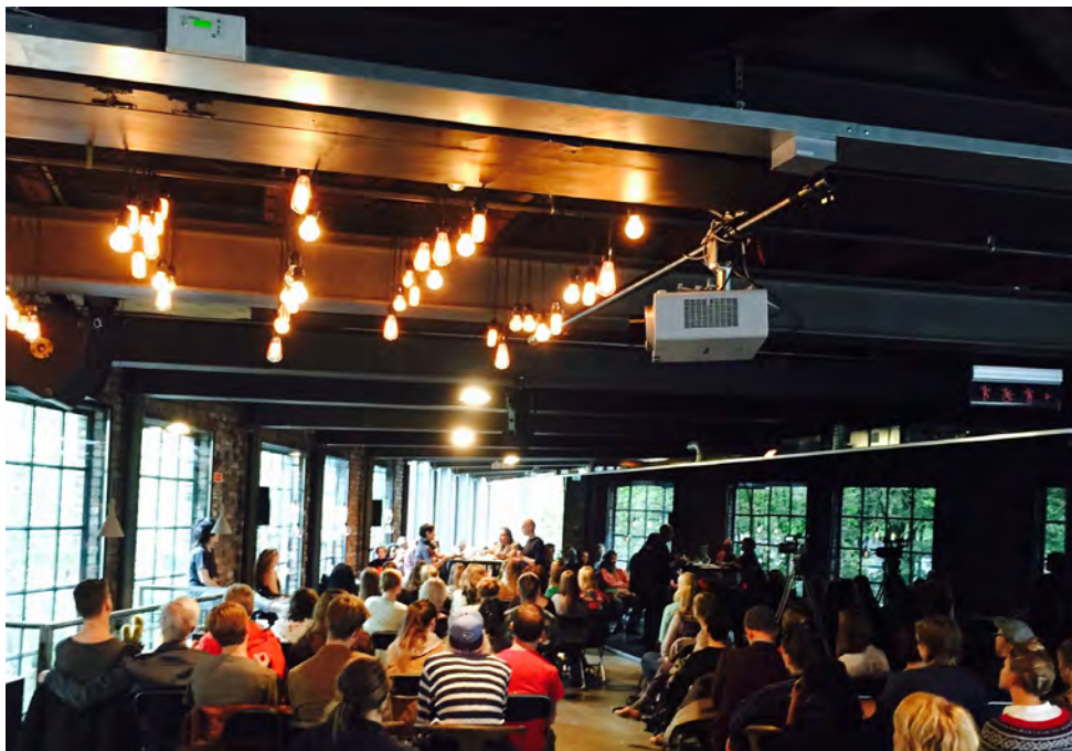
Danserisk Samtale 20. september