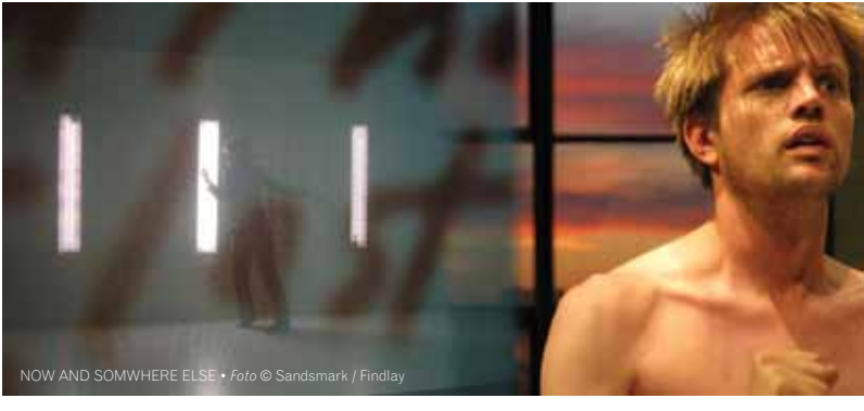
NOW AND SOMWHERE ELSE • Foto © Sidselmark / Findlay

Carte Blanche (Norge) KLOKKA 3 Studio Bergen 30. oktober kl 1930 www.cartebianche.no