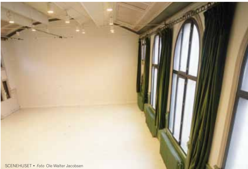
SCENEHuset - Foto: Ole Walter Jacobsen

Norske Dansekunstnere (NoDa) er: - landsomfattende - fagforbund - kunstnerforbund - interesseorganisasjon NoDa er, med rundt 850 medlemmer fra hele landet, representativt for dansefeltet. Gjennom vår faglige kompetanse og vårt fokus er vi toneangivende pådriver i norsk politikk for dans. Du står sterkere med NoDa i ryggen! Velkommen som medlem!