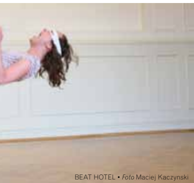
BEAT HOTEL