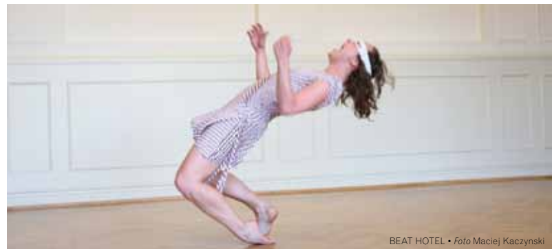
BEAT HOTEL