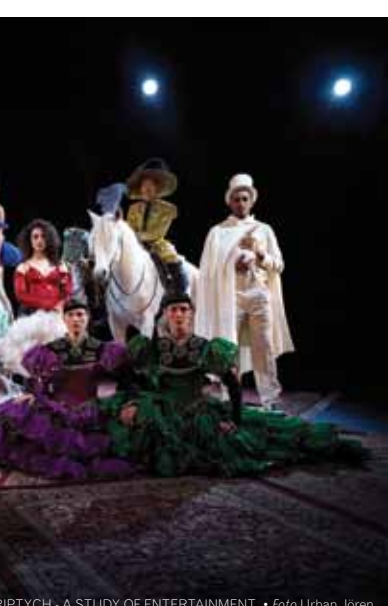
EKMAN'S TRIPTYCH - A STUDY OF ENTERTAINMENT