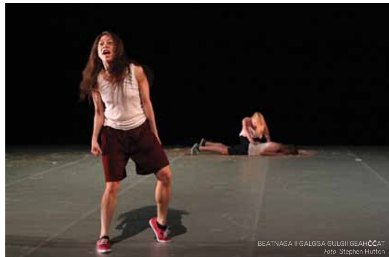
BEATNAGA II GALGGA GULGII GEAHCCAT