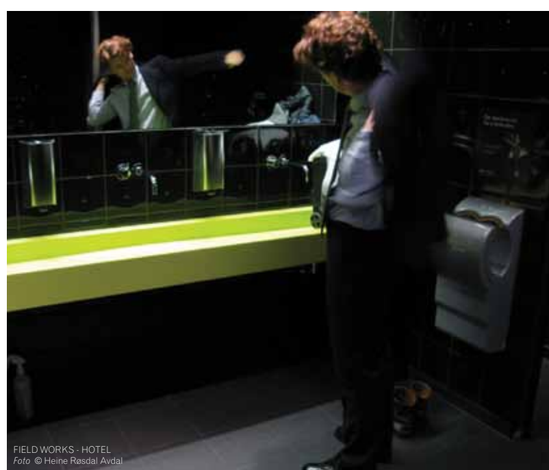
FIELD WORKS - HOTEL