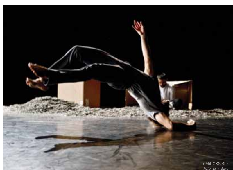
IMPOSSIBLE