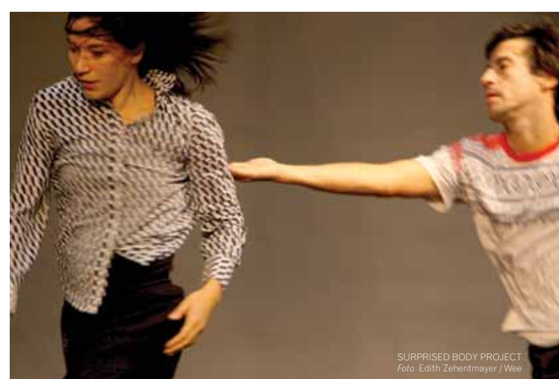
SURPRISED BODY PROJECT

Nasjonalletten DON QUIXOTE Den Norske Opera & Ballett 24. og 26. februar kl 1900 26. februar kl 1800 Koreografi: Ludvig Nurejev etter M. Petipa Musikk: Rudolf Minkus www.operaen.no Billetter: 21 42 21 21