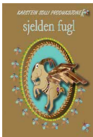
KARSTEIN SOLLI PRODUKSJONER

Cullbergbaletten (Sverige) TRUE STORIES OF CASTAWAYS AND OTHER SURVIVORS Bærum kulturhus, Sandvika 11. og 19. mars kl 1930 Koreografi: Ina Christel Johannessens Lysdesign: Kyrre Heldal Karlsen Scenografi: Graa hverdag as www.cullbergbaletten.se Billetter: 815 11 777