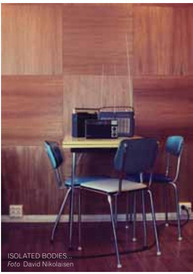
ISOLATED BODIES